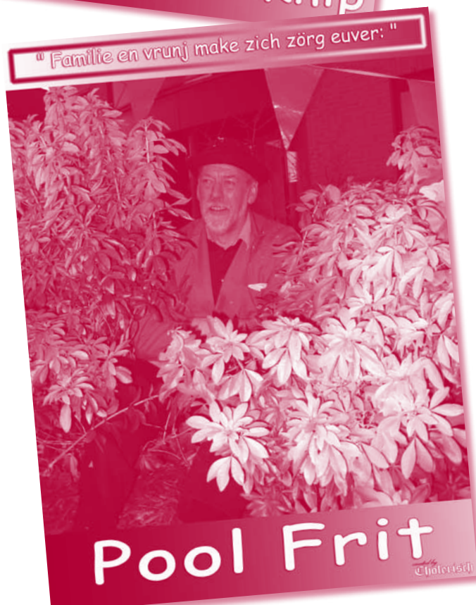
"Familie en vrunj make zich zörg euver: "