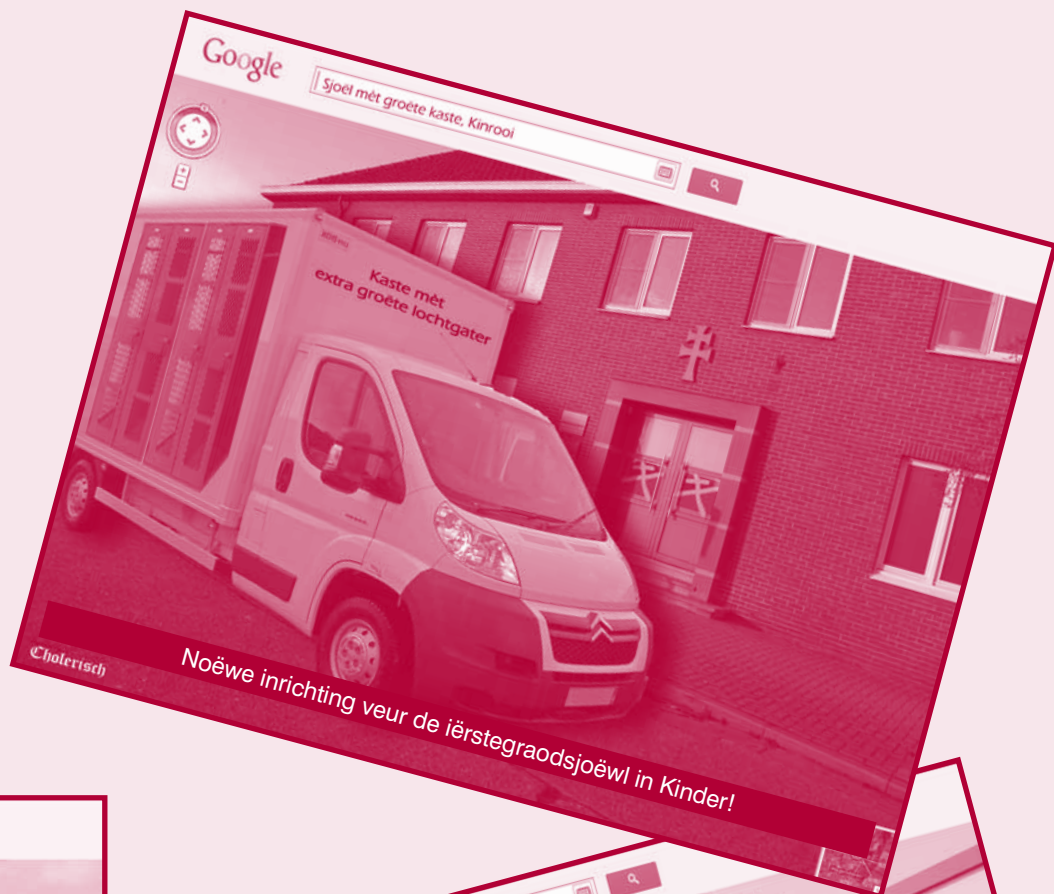
Noëwe inrichting veur de ierstegraadsjoëwl in Kinder!