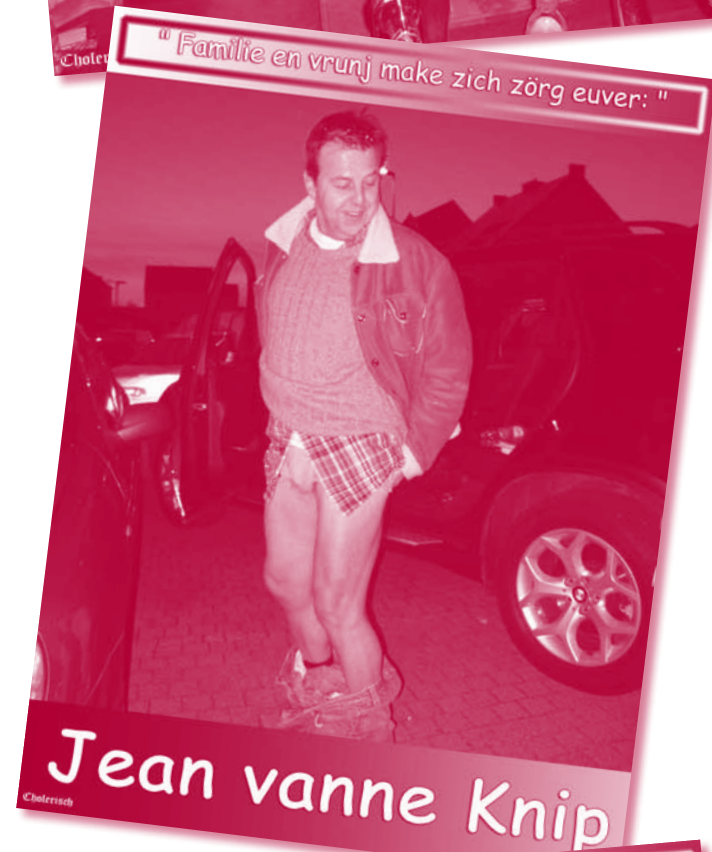
"Familie en vrunj make zich zörg euver: "

"Des nog niks, Pé. Ich hoop det de brouwer al langs is gewèest!"