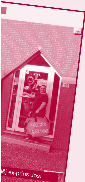
ëj ex-prins Jos!