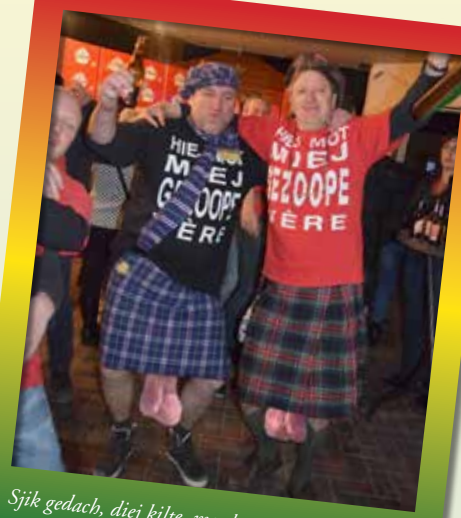
Sjik gedach, diej kilte, mer het zoörgdje waal veur get piënlikke vaststèllinge. Zoëwaal bie Tjeu es bie Bèr heet de zwaortekrach het gewónne van het liëf...