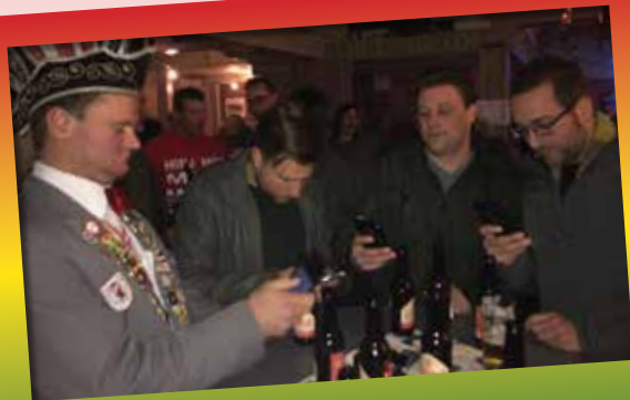
Veur de ónvergètelikke ambiejaos en gezelligheid zörgdje veural de kèerels ónger de 40 jaor...