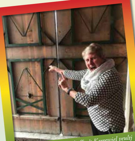
Annie vanne vreugere kaffee 't Karrewiel veultj zich oppe slaag weer toès. "Het is hiej zoë gezellig rómmeilig. 't Stuit hiej vol mèt kraom. Zoë eine aoje rómmeil haaje wèe indertiéd in ózze kaffee aane plafõng hange!"