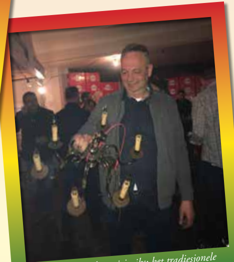
Vreuger ging het wiej niks: het tradiesjonele 'lusterhangé'. Vandaag d'n daag luptj het al drek mis. Eederein is den ouch gemiddeldj 15 kilo zwaarder es indertiéd...