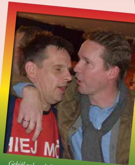
Gehiël volges de leste pollerieke trends, vreugtj Brouns aan Boets of dee neet es ónaafbankelikke bjum oppe liest wou staon. Boets weigerdje.