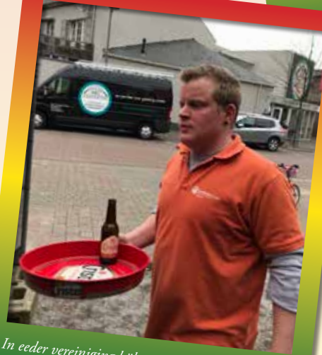
In eeder vereiniging hóbse wirkpèerd en luksepèerd. Dean haaj gein zin ôm garcon te speule in en brach oët protest mer 1 pint per kiër rón dj.