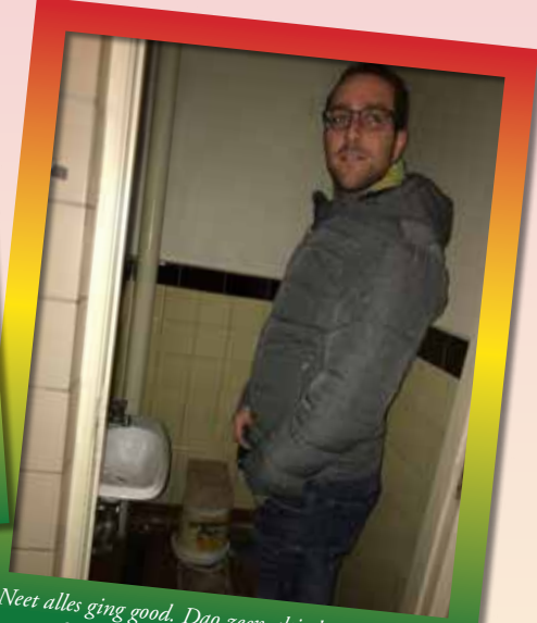
Neet alles ging good. Dao zeen al tied sjarels bie diej dinke det ze inne pòmmbak moge pisse!