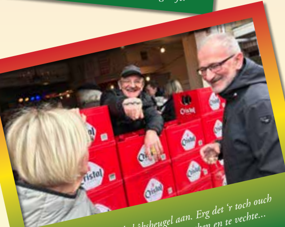
Jean Donnè haaj de bókseugel aan. Erg det 'r toch ouch al tied volk kumpjt óm ruzie te maken en te vechte...